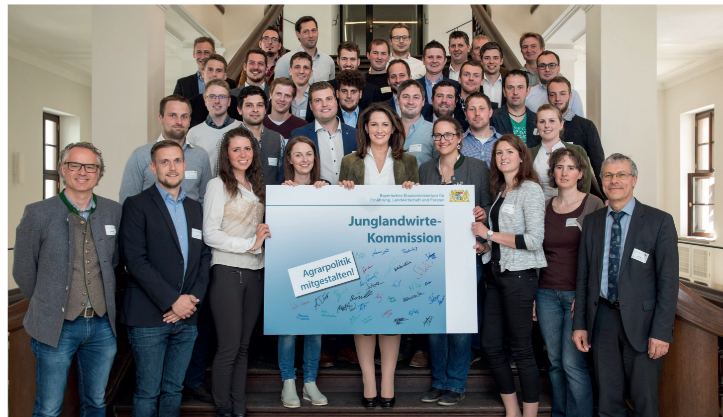
Die Junglandwirte-Kommission mit Landwirtschaftsministerin Michaela Kaniber

Wir Landwirte unternehmen große Anstrengungen, um unsere Nutztiere bestmöglich zu halten und das Tierwohl zu fördern. Wir wollen, dass es unseren Tieren auch nach dem Verlassen des Hofes gut geht. Daher müssen Schlachtviehtransporte auf eine maximale Entfernung von 400 Kilometern beschränkt werden. Dies setzt allerdings voraus, dass in ausreichendem Umfang regionale Schlacht- und Verarbeitungsstrukturen vorhanden sind. Ex- und Importe von lebendem Schlachtvieh in die und aus der EU sind zeitnah EU-weit zu verbieten.