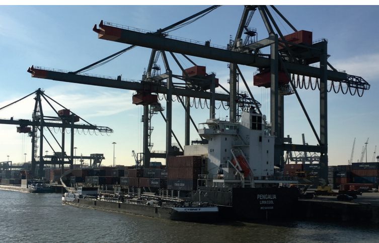
Es ist ein sozial-ökologischer Außenschutz für Lebensmittelimporte in die EU erforderlich

Dafür brauchen wir aber einen breiten Rückhalt in der Bevölkerung, gleiche Wettbewerbsbedingungen wie unsere Mitbewerber sowie eine verlässliche und kraftvolle Unterstützung durch die Politik.