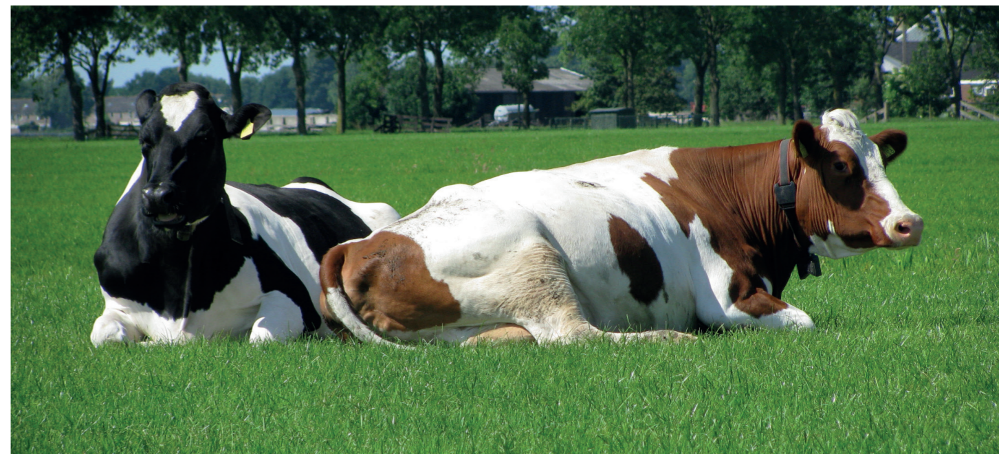
Einführung eines "KULAP für Tiere"

begehungen, Ferienprogramme, vielfältige Fruchtfolgen auf einem Feldstück etc.