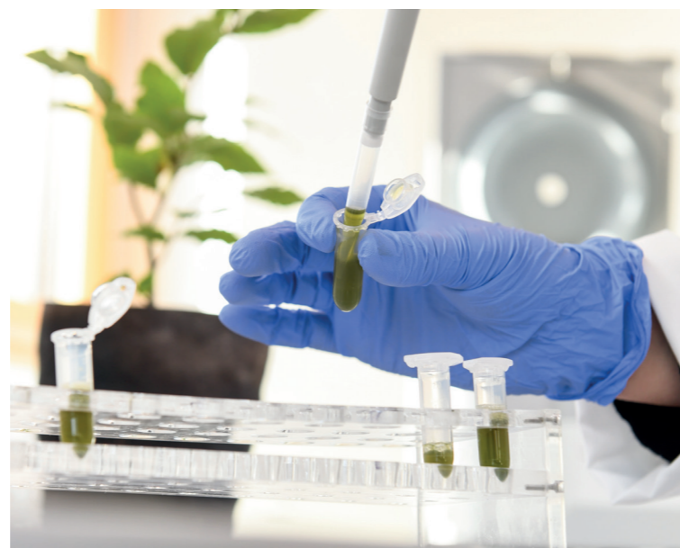
Es muss mehr getan werden in der Agrarforschung und die Ergebnisse müssen schneller bei den Landwirten ankommen

Es werden zwar von EU, Bund und Land bereits große Summen in die Agrarforschung investiert, bei uns Landwirten