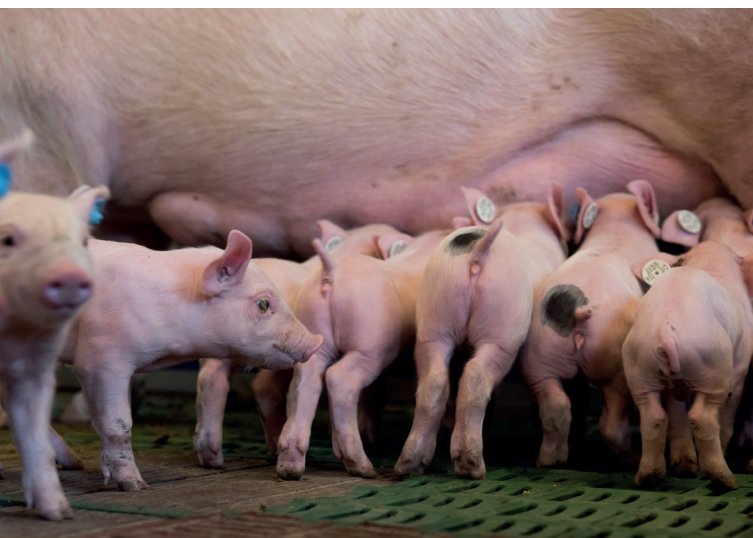
Die heimische Ferkelerzeugung soll gestärkt werden

Auch bei den Kälbern fordern wir geeignete Maßnahmen und Konzepte, um die regionale Mast auf- und auszubauen und um Exporte über weite Strecken, beispielsweise nach Südeuropa, sukzessive zu verringern.