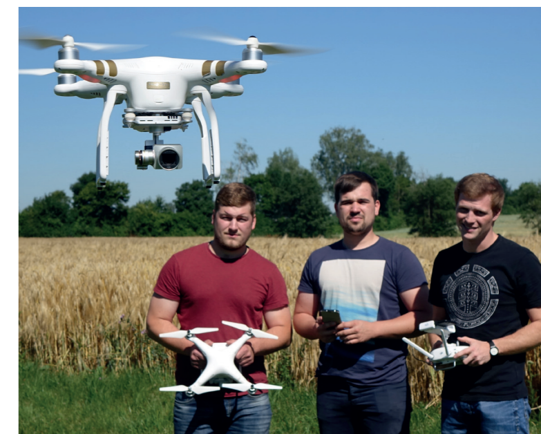
Digitalisierung bietet viele Chancen für die Landwirtschaft