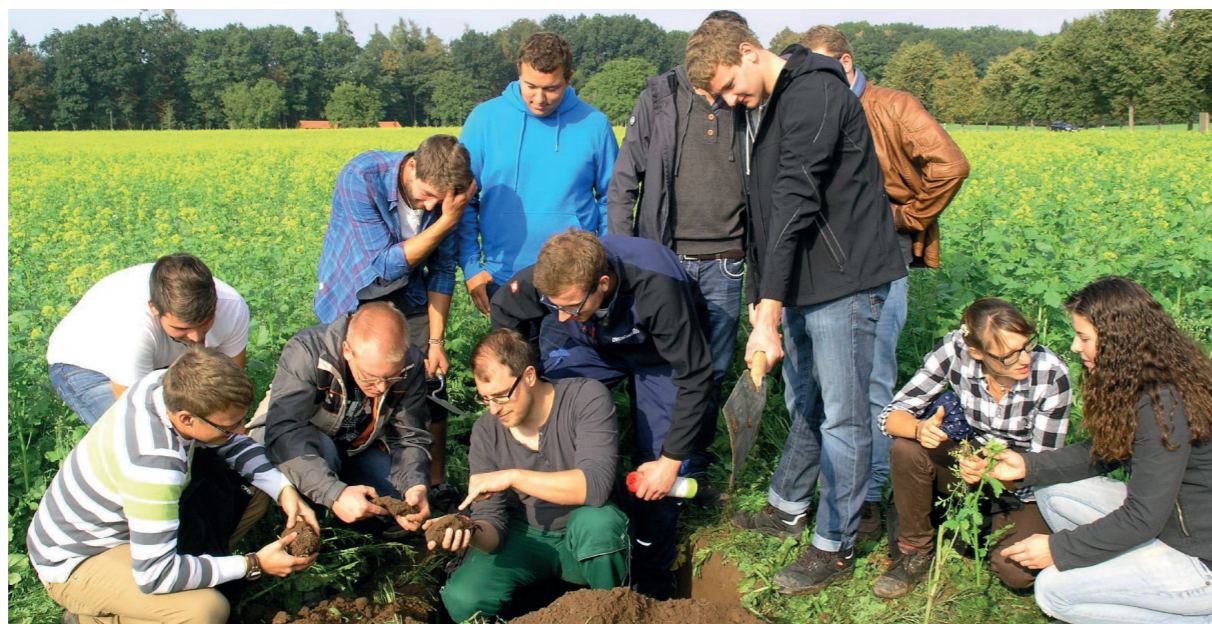
Eine praxisnahe Bildung muss für alle Landwirte verpflichtend sein