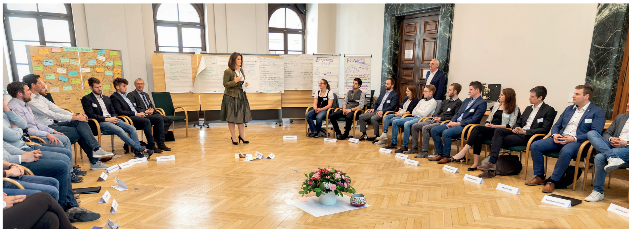
Die Junglandwirte-Kommission im Gespräch mit Frau Staatsministerin Michaela Kaniber

Tierschutz und Tierwohl liegen uns sehr am Herzen. Daher fordern wir die Staatsregierung auf, die Ferkelerzeugung in Bayern gezielt zu stärken, um die Abhängigkeit von Ferkelerzeugern nach Bayern zu vermindern. Die bayerischen Ferkelerzeuger brauchen rasch Klarheit bei den Haltungsbedingungen, möglichst lange Planungssicherheit und eine kraftvolle finanzielle Unterstützung bei erforderlichen Umbaumaßnahmen, um zukünftig bestehen zu können.