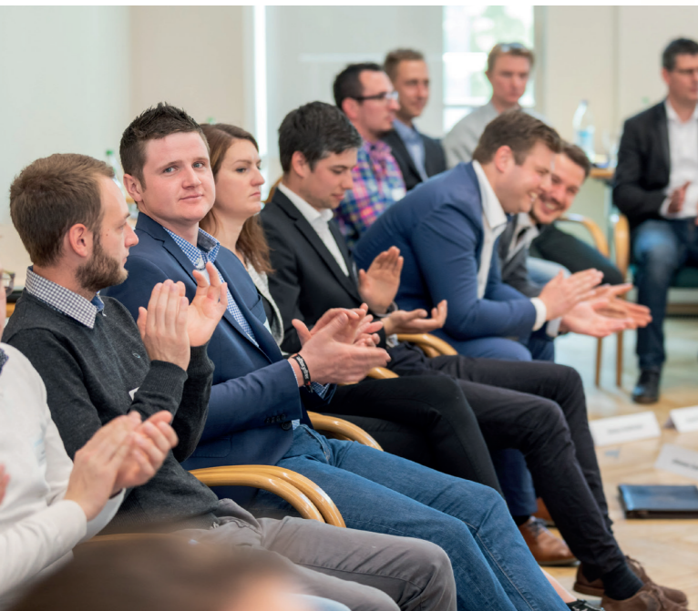
Mitglieder der Junglandwirte-Kommission